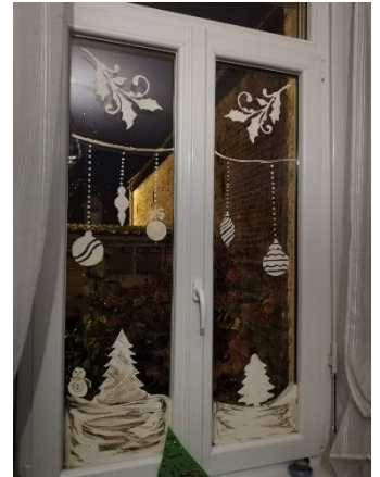
Fenêtre de Mathilde participante au Programme consom'acteurs

Pour plus d'astuces : rendez-vous sur symevad.org